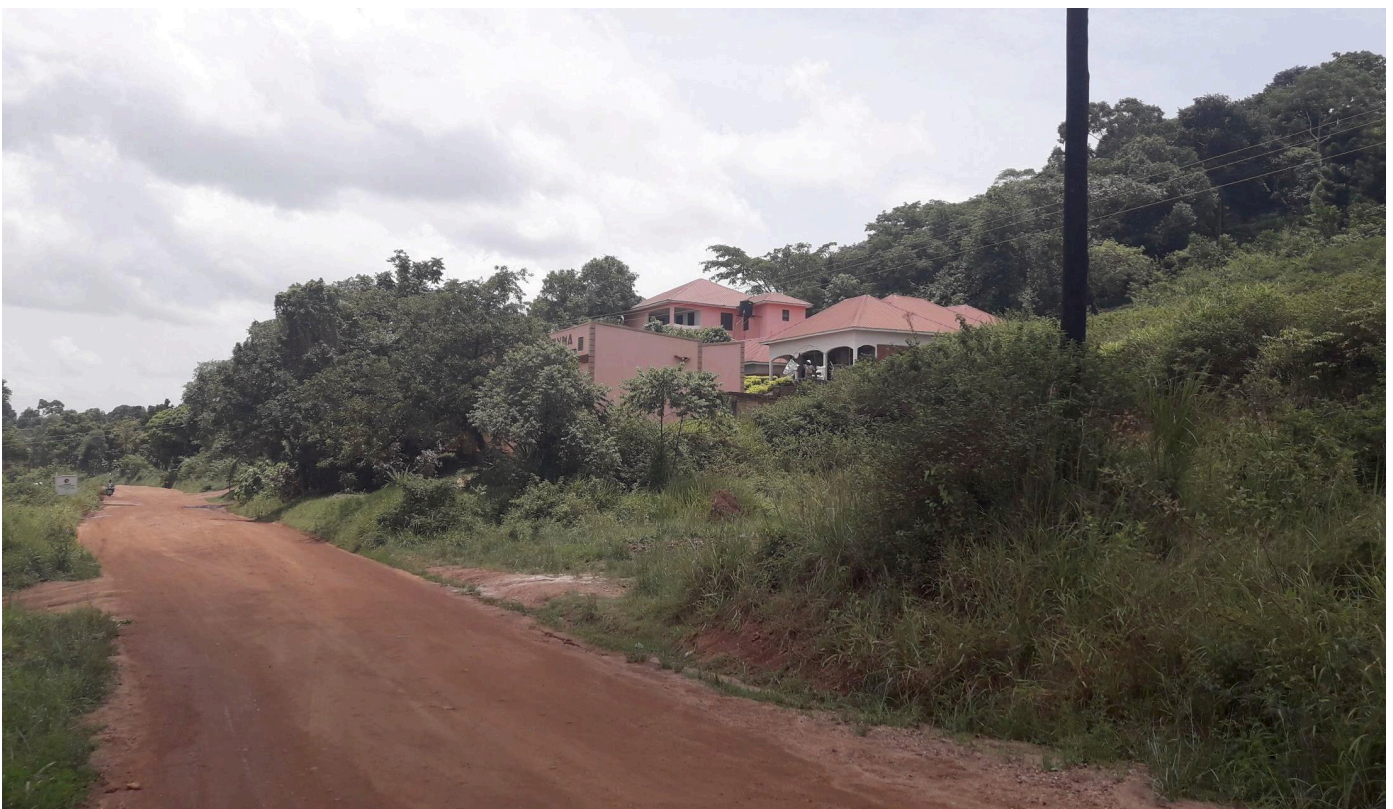
Escuela de Bellas Artes e Industrial Margaret Trowell, Makerere