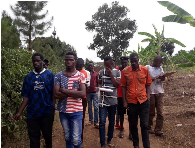
Lectura y excursionismo