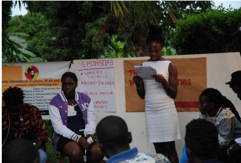
Lectura colectiva de material histórico