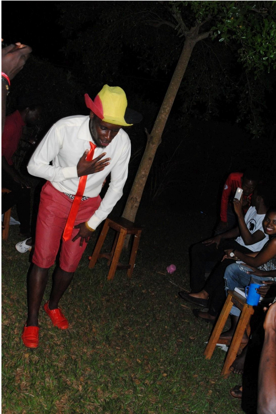
Un estudiante interpretando su composición durante la sesión de lectura organizada por los estudiantes de diseño de publicaciones