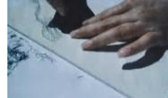
EL cuerpo del docente/ el cuerpo de haceredor/ el cuerpo usente de la obra

¿Cuál es la corporalidad que subyace a los oficios manuales?