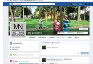
Registro, palabra e institución

Como decía anteriormente, el hecho de que la formación de artistas se esté realizando dentro de las lógicas institucionales de la educación superior, en este caso la Universidad Nacional, una universidad pública, el impacto sobre la noción de formación y enseñanza del arte es directa. De esta manera lo expresa el PEPAP.