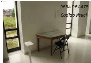
OBRA DE ARTE Código visual

¿Cuál es la corporalidad que subyace a los oficios manuales?