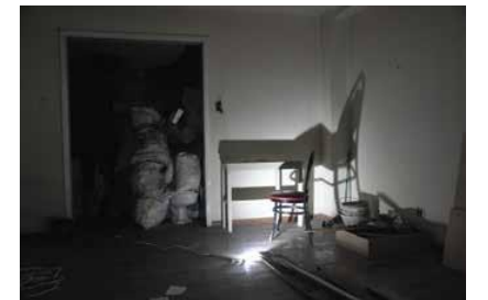
EL ROL DEL ARTISTA PROFESIONALIZADO

Esa sensación de porosidad e incluso falta de articulación curricular en las instituciones educativas del arte, son sintoma de una de las condiciones posmodernas. A saber, el de la desjerarquización del conocimiento, la desestructuración de la interpretación de significados en las obras y las relaciones múltiples del saber. En palabras de Efland, "Como en un collage, la educación, entendida en clave posmoderna, está repleta de significados múltiples, complejos y discontinuos" [6]. El esfuerzo tanto del docente como del estudiante por hacer red, es tarea cotidiana dentro de la lógica curricular en la educación artística. Sensaciones de este orden fueron expresadas también por los estudiantes