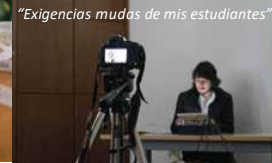
"Exigencias mudas de mis estudiantes"