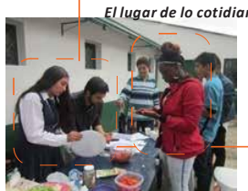
El lugar de lo cotidiano

Como decía anteriormente, el hecho de que la formación de artistas se esté realizando dentro de las lógicas institucionales de la educación superior, en este caso la Universidad Nacional, una universidad pública, el impacto sobre la noción de formación y enseñanza del arte es directa. De esta manera lo expresa el PEPAP.