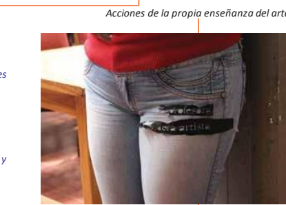
Acciones de la propia enseñanza del arte