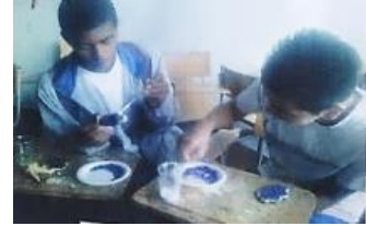
Contexto comunitario Dimensión social Esfera política

Tiempo cobra mas fuerza y es la dimensión social del acto pedagógico y artístico.