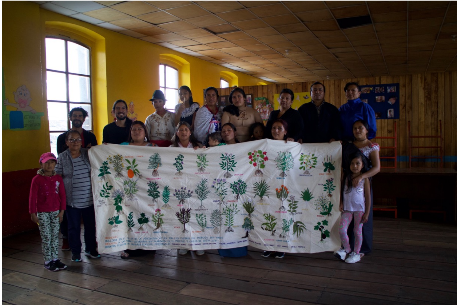
Taller Mujeres Bordando en el Mercado San Roque, Quito 2018